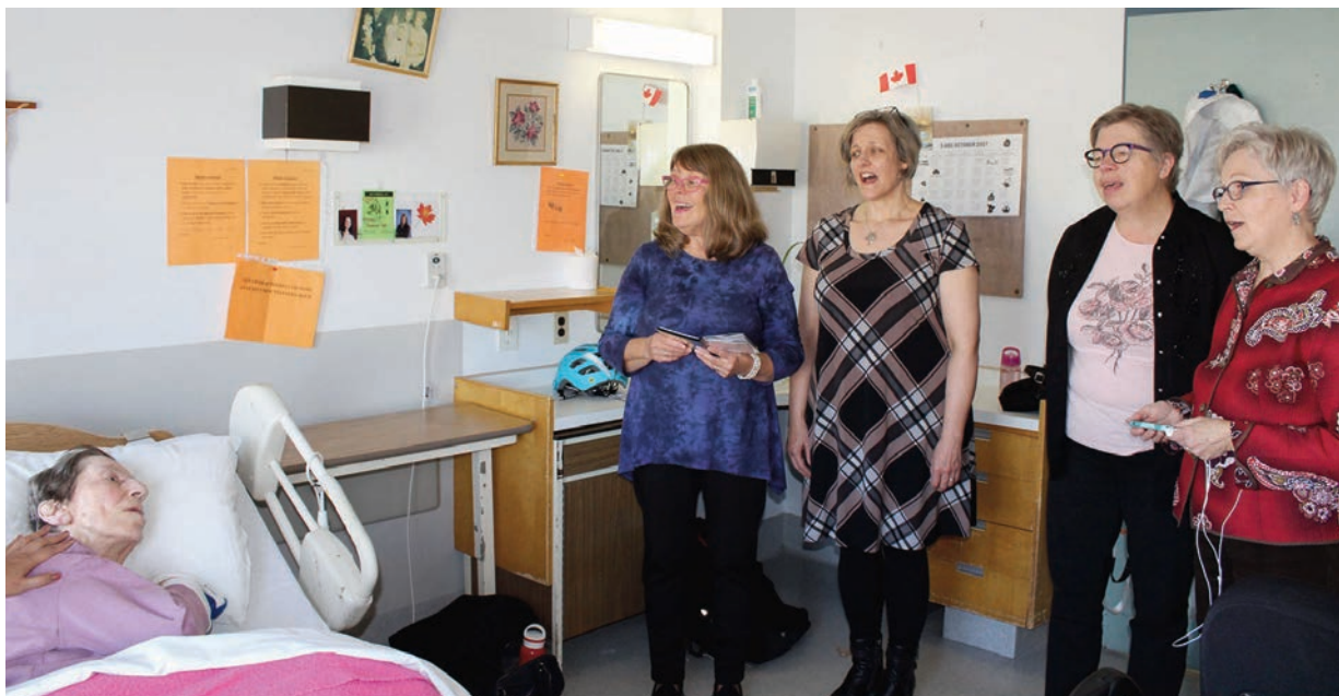
La chorale Comfort Choir apaise les résidents par leurs chants. / The Comfort Choir soothes residents with their songs.