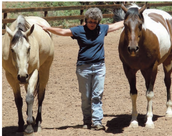
Le Cloud 9 Ranch organise des programmes thérapeutiques. / The Cloud 9 Ranch facility offers therapeutic programs.

Une expérience comme celle-ci est en effet un moyen de faire ressortir des souvenirs chez les résidents. « Certains d'entre eux ont grandi sur une ferme, et les gestes familiers étaient encore là. Quelques résidents ne voulaient pas monter sur un cheval, mais quand ils ont vu tout le monde s'amuser, ils ont changé d'avis. À la fin, ils ne voulaient plus descendre. C'était vraiment une expérience magique. »